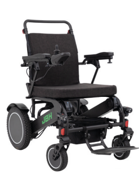
JBH® Carbon 21